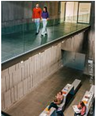
mumok – Museum moderner Kunst mumok – museum of modern art

Leopold Museum ◆ WIEN 1900. Meisterwerke Klimt & Schiele ◆ MAX OPPENHEIMER. Expressionist der ersten Stunde (bis / until 25.2.) ◆ GABRIELE MÜNTER. Retrospektive (bis / until 18.2.) Mo, Mi–So / Mon, Wed–Sun & 19.12., 26.12. | 2.1. 10.00–18.00 24.12. geschlossen / closed 31.12. 10.00–17.00 www.leopoldmuseum.org