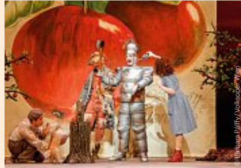
Der Zauberer von Oz, Volksoper Wien The Wizard of Oz, Vienna Volksoper

With more than 60 million records sold, numerous number 1 hits and songs in the charts of 27 countries, Falco is still considered one of Europe's most successful pop stars. His fan base is huge: from those who saw him live back in the day to the youngest who sing along to their favorite song "Nie mehr Schule" by heart.