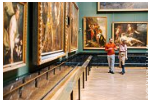
Kunsthistorisches Museum Wien

◆ KLIMT LOST | KLIMTS LEBEN UND WERK, 1911–1918 13., Feldmühlgasse 11 Mi–So / Wed–Sun 10.00–18.00 31.12. 10.00–14.00 24.12. | 3.–6.1. geschlossen / closed www.klimtvilla.at