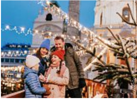
Art Advent am Karlsplatz Art Advent on Karlsplatz