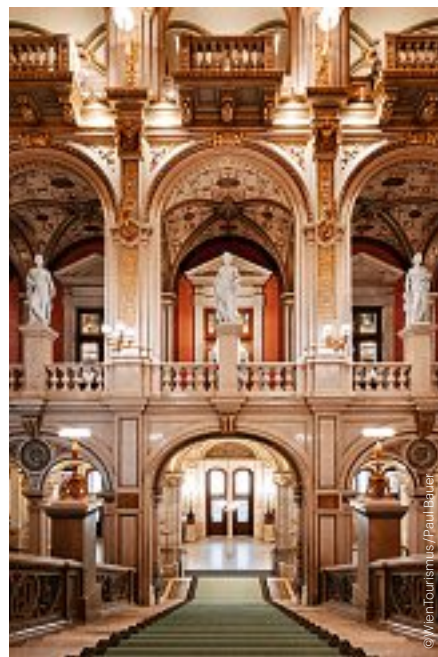
Wiener Staatsoper Vienna State Opera

◆ ROMÉO ET JULIETTE, Oper von C. Gounod 23.2. (P), 25., 28.2.