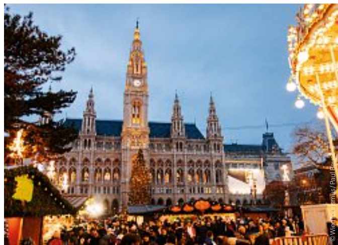
Wiener Christkindlmarkt auf dem Rathausplatz Vienna Christmas Market on Rathausplatz

Mo–Do / Mon–Thu 11.00–21.00 Fr–So, Ftg / Fri–Sun, hol 10.00–21.00 1., Am Hof www.weihnachtsmarkt-hof.at