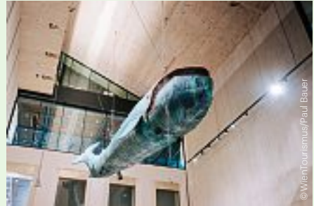
Maskottchen „Poldi“ baumelt von der Decke der neugeschaffenen großen Halle. Mascot “Poldi” dangles from the ceiling of the newly created hall.

The biggest challenge for the Wien Museum team was planning and designing the new permanent exhibition, Bunzl reveals. “The permanent exhibition covers the official history of the city. To be entrusted with such a project is an incredible honor and at the same time a major challenge. The museum’s collection is vast, the city’s history is rich and complex, and the stories to be told are many and varied.”