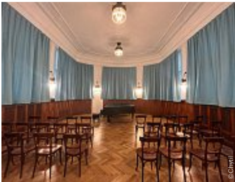
Der kleine Saal im Palais Ehrbar mit seiner intimen Atmosphäre The small hall in the Palais Ehrbar with its intimate atmosphere

Even though greats such as Johannes Brahms, Gustav Mahler and Arnold Schönberg once performed their works here, the Ehrbar Hall, located in the heart of the Freihausviertel, fell into obscurity for a long time. During the two world wars it was even used as stables for animals and as a military hospital. Until recently, it was used almost exclusively as a music conservatory – concerts were arranged from time to time. The German piano manufacturer C. Bechstein is now breathing new life into this almost forgotten jewel and wants to restore the Ehrbar Hall to Vienna's cultural scene. And quite right too!