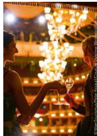
Wiener Opernball Vienna Opera Ball

◆ JÄGERBALL HUNTERS' BALL Wiener Hofburg www.verein-grueneskreuz.at