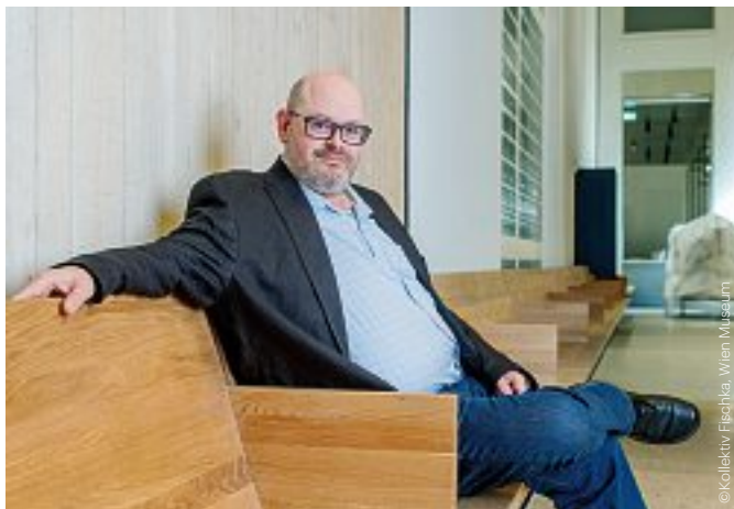
Direktor Matti Bunzl in der großen Halle des neuen Wien Museums Director Matti Bunzl in the large hall of the new Wien Museum

„Ich wünsche mir, dass die Wiener:innen, alle Besucher:innen, eine Freude mit diesem Haus haben werden. Ich kann es gar nicht erwarten, das neue Wien Museum der Öffentlichkeit präsentieren zu können“, freut sich Direktor Matti Bunzl im Interview mit spot.