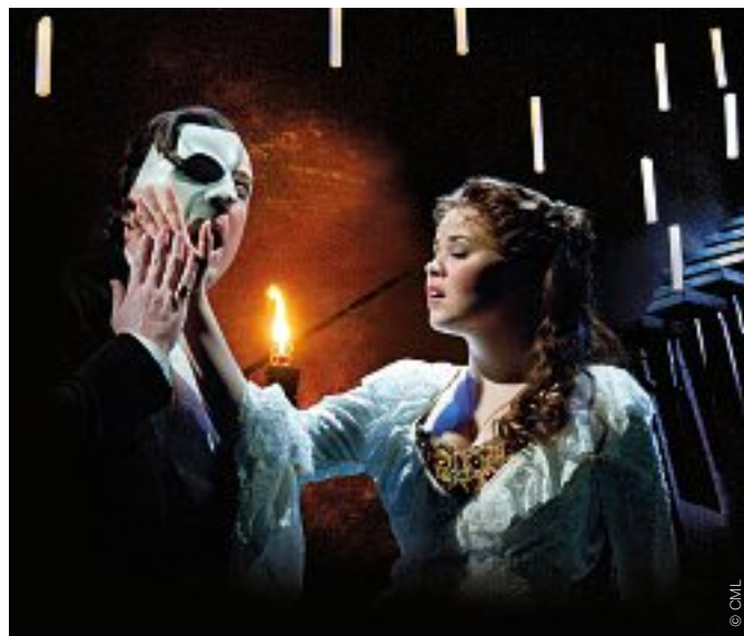
Das Phantom der Oper , ab 15. März im Raimund Theater The Phantom of the Opera, from March 15 at the Raimund Theater